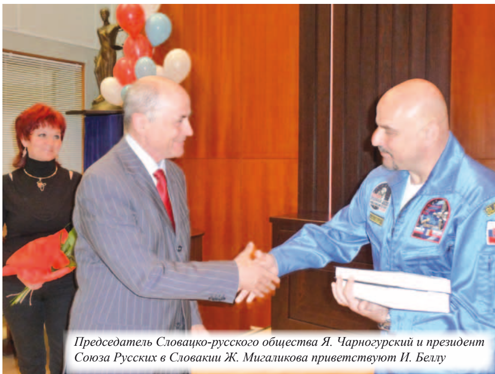
Председатель Словацко-русского общества Я. Чарногурский и президент Союза Русских в Словакии Ж. Мигаликова приветствуют И. Беллу

Это впечатление от космонавта Ивана Беллы оказалось настолько сильным, что во всех присутствующих крепло чувство гордости и патриотизма. Потому что он – НАШ. И от нашего имени достиг действительно МНОГО!