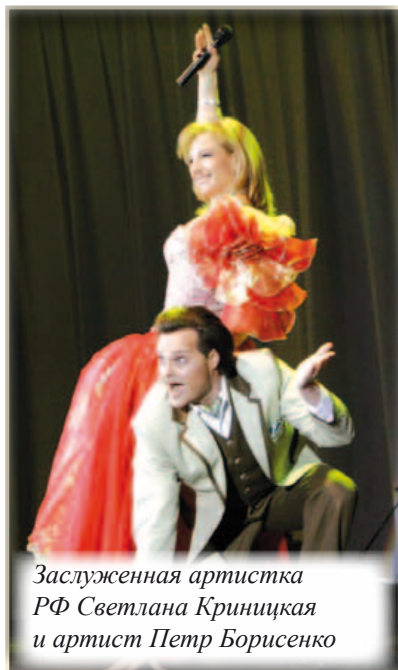
Заслуженная артистка РФ Светлана Криницкая и артист Петр Борисенко

В России лучший в мире юмор, самые красивые люди, мало хороших дорог, отсутствие всяческих условностей, грипп и скарлатина – что ещё надо настоящей путешественнице?!