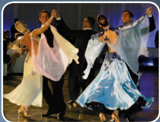
Первый Русский бал в Братиславе

журнал общества Союз Русских в Словакии časopis spoločnosti Zväz Rusov na Slovensku