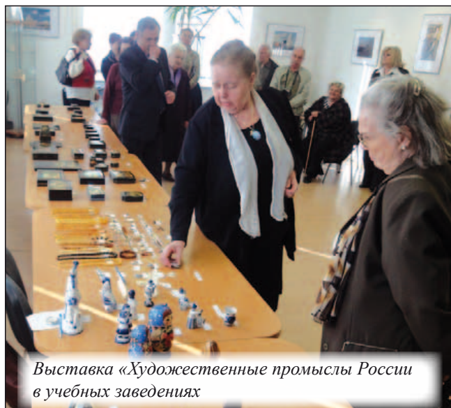
Выставка «Художественные промыслы России в учебных заведениях»

стоит встреча россиян с супругой главы государства Сильвией Гашпаровичовой.