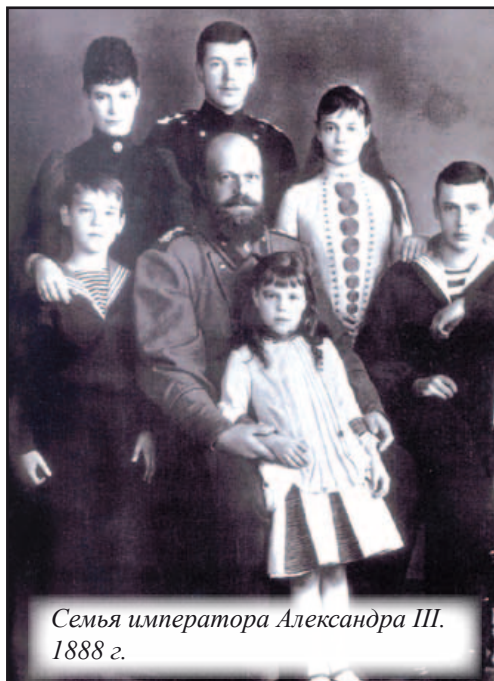
Семья императора Александра III. 1888 г.

Многие семьи, оказавшиеся на чужбине без дома и денег, выжили только благодаря ее поддержке. Ее собственные средства были весьма ограничены, но она делилась последним, помогала найти работу на первое время, как-то обустроиться. Когда подросли дети, все больше времени можно было уделять творчеству. А оно было очень многогранно: писание икон, роспись фарфора, живопись маслом, большое количество акварелей. Ольга Алексан-