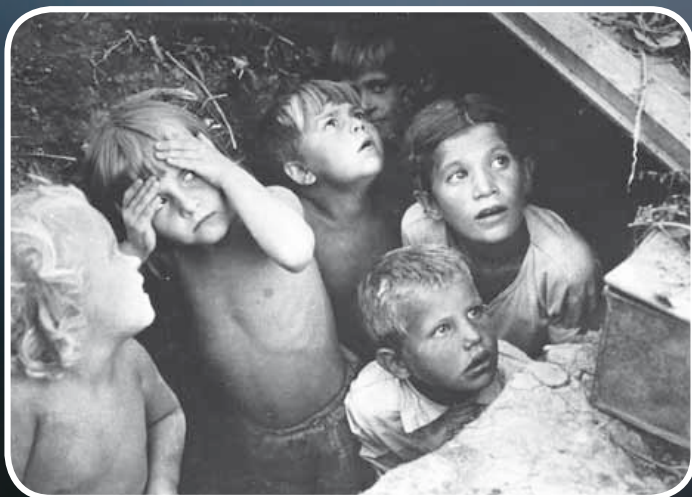
1941 - 45. Не забудем никого...