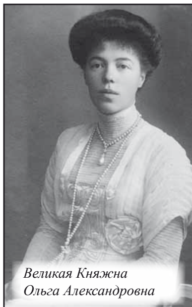
Великая Княжна Ольга Александровна