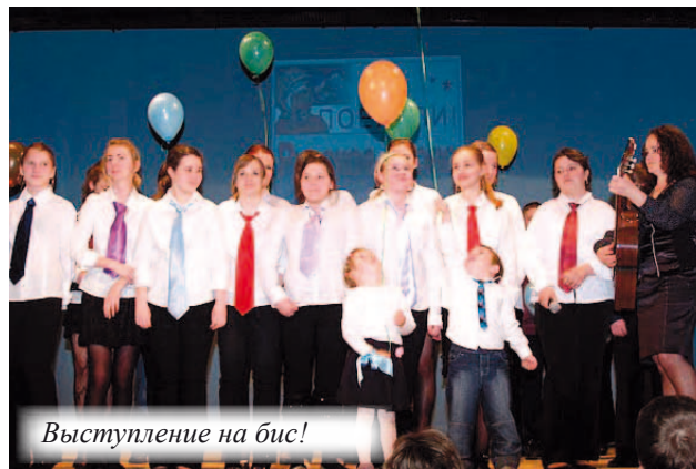
Выступление на бис!

В просторном фойе разместилась выставка рисунков «Мечтаем о космосе». Всего на конкурс пришло 220 рисунков. Наряду с официальным жюри очень активно работало и детское жюри. Рисунки поражали своим разнообразием, красками, интересными сюжетами. Внимание участников и гостей праздника привлекала ещё одна выставка – «Русский сувенир». Её подготовили ученики из общеобразовательной школы Молдава